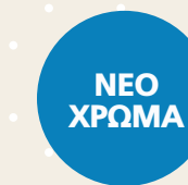
Neptune blue (Μπλέ)