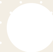
Artic white (Λευκό)